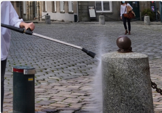
Lavage Haute Pression

Désherbeuse à eau chaude + Lavage Haute Pression / Eau Chaude